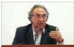
Huguera, Hila y el conseller d'Educació, muchas y buenas palabras, pero nada más.