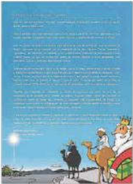
La carta enviada a los Magos de Oriente.