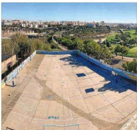
Piden la ampliación del patio del centro escolar Marian Aguiló.

«También poco después, la ampliación del patio fue una de las propuestas de los alumnos de 6º, dentro del marco Proyecto Ciutat Escola del convenio de colaboración entre las áreas