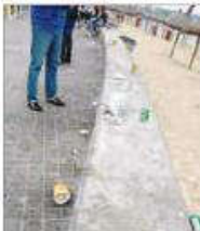
¿Es la imagen que queremos?